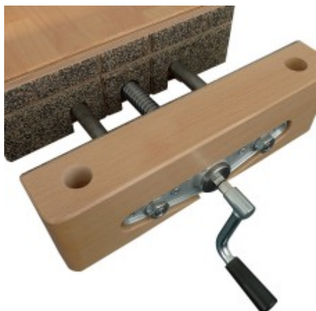
Variogrip vložka - protikus k čelisti