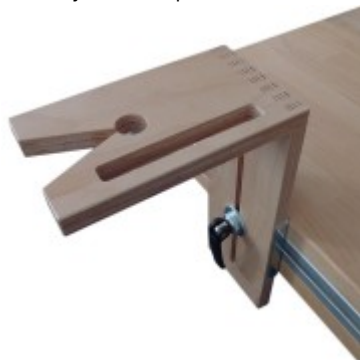
Pro řezání lupínkovou pilou