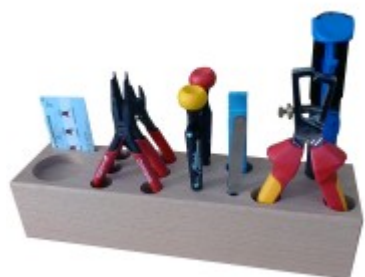
Sada nářadí - elektro