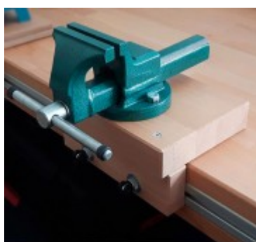
Dílenský svěrák s podložkou