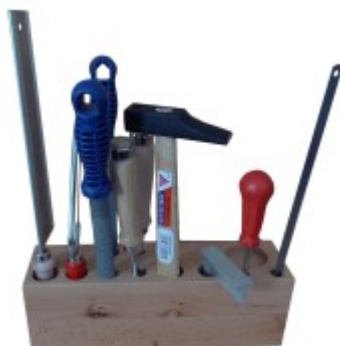
Sada nářadí - dřevo